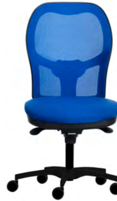
9.314-RAS Red Azul (Az)