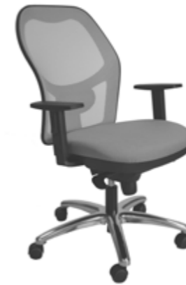
9.314-RAS C/B-2 Red Gris