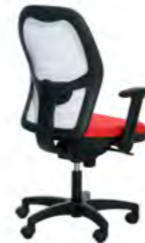
9.314-RAS C/B-3 Red Blanco (BL)